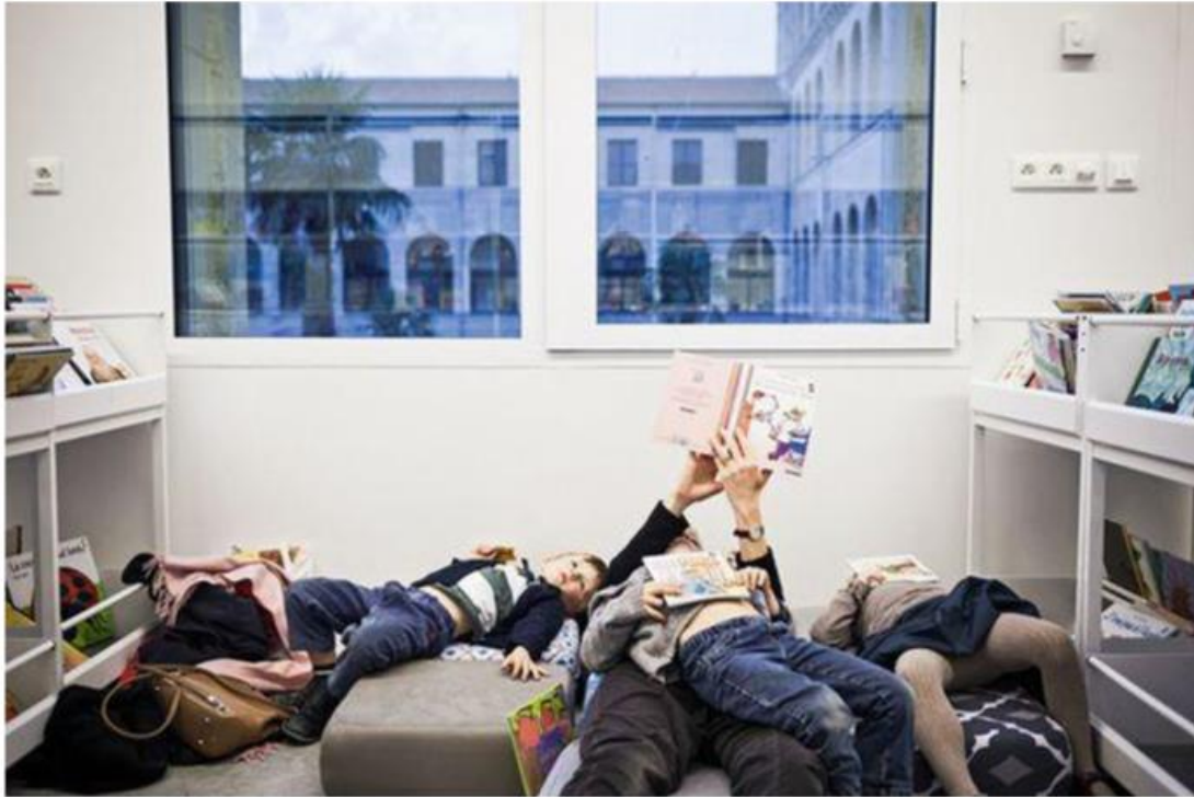
À la médiathèque Françoise Sagan à Paris

« La lecture ne peut pas réparer le monde de ses désordres. Elle ne garantit pas forcément un devenir scolaire plus réussi. Elle ne rend pas vertueux (...) Alors pourquoi inciter des enfants, des adolescents, des adultes, à lire ? (...)